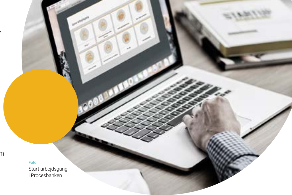
Foto Start arbejdsdag i Procesbanken

Det skal være så let og billigt som muligt at komme i gang med digitalisering. Derfor åbner DitmerFlex på sigt op for, at I kan dele jeres løsninger med andre offentlige myndigheder. Det vil give dig endnu mere digital inspiration – uden brug af konsulenter.